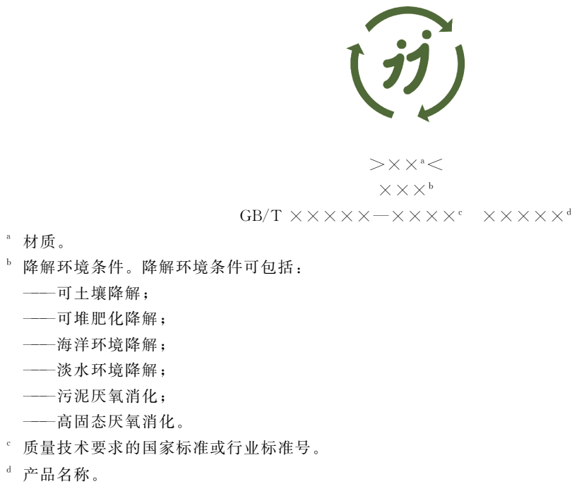
图 1 生物降解塑料与制品标识

示例 1: PBAT 和 CaCO 3 制备的非食品接触用生物降解塑料购物袋的标识。